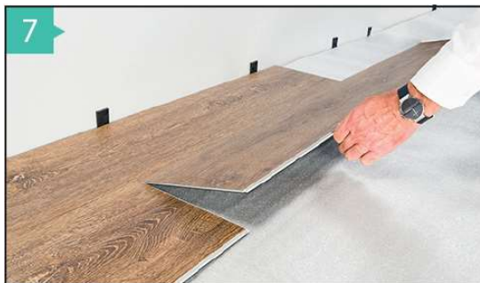
7 ABSCHLUSS DER ERSTEN BEIDEN REIHEN Verlegen Sie nun abwechselnd die Dielen der Reihen 1 und 2. Ab Reihe 3 ist keine Verlegung von 2 Reihen mit wechselnden Dielen erforderlich. Jede Reihe kann für sich komplett fertig verlegt werden.