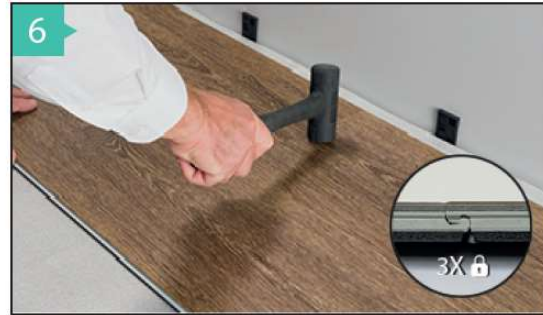
6 ABLEGEN DER LANGEN DIELE AUF DIE KURZE SEITE DER DIELE Schlagen Sie mit dem Gummihammer leicht auf die Verbindung der beiden Dielen. Schlagen Sie bitte rechts vom Stoß der beiden Dielen, so verriegelt die Verbindung optimal. Um die Längsseiten komplett ohne Fugen zu bekommen, legen Sie den Schlagklotz vorne leicht auf die Längsseite der Diele (2) und schlagen ggfs. die Dielen fugenfrei zusammen.