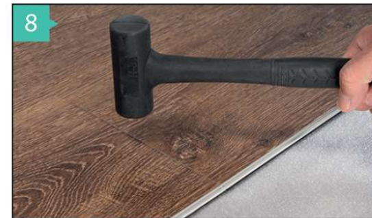
8 VERLEGUNG AB DER DRITTE REIHE Verlegen Sie wie in den ersten beiden Reihen indem Sie die Dielen in die vorherige Reihe einwinkeln, die Diele ganz nach links schieben und dann die Kopfseite mit dem Gummihammer verriegeln und die Längsseite mit einem Schlagklotz komplett schließen.

ACHTUNG: Bitte schließen Sie erst mit dem Schlagklotz die Längsseite bevor Sie mit dem Gummihammer die Stirnseite schließen. Achten Sie bitte darauf, dass die Kopfverbindung über die gesamte Breite dicht und bündig verschlossen ist.